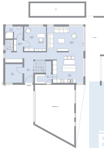
Haus Erhardt Grundriss EG bemast