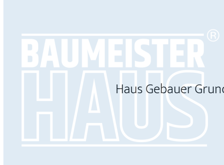
Haus Gebauer Grundriss OG