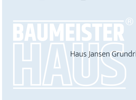
Haus Jansen Grundriss